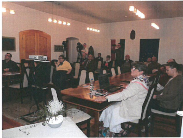
A konferencia közönsége